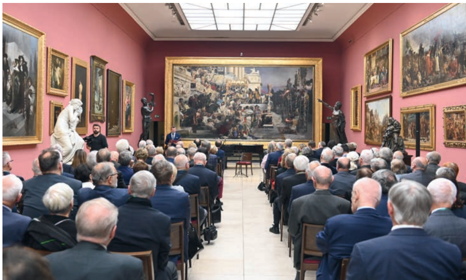
Ryc. 2. Odczytanie Uchwały Kapituły przyznającej Nagrodę Lednickiego Orła Piastowskiego Polskiej Akademii Umiejętności.