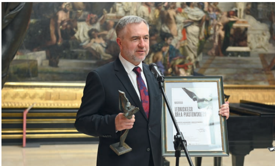
Ryc. 3. Przemówienie Marszałka Województwa Wielkopolskiego Marka Woźniaka. FIG. 3. Speech by the Marshal of the Wielkopolska Region, Marek Woźniak.