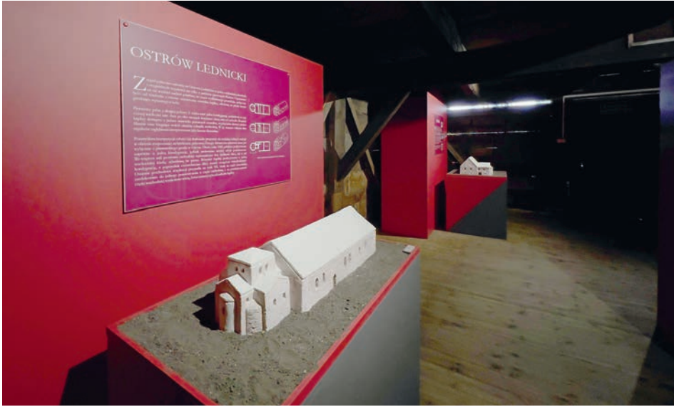
RYC. 1. Wystawa pt. „Wczesnośredniowieczne rezydencje władców Europy Środkowej”, widok na rekonstrukcję palatium z Ostrowa Lednickiego.