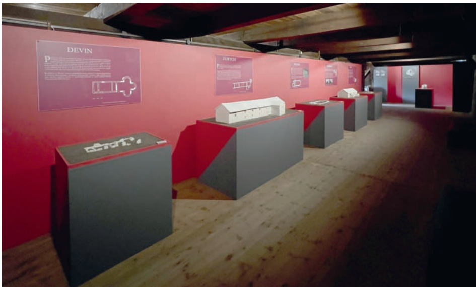
RYC. 2. Wystawa pt. „Wczesnośredniowieczne rezydencje władców Europy Środkowej”.