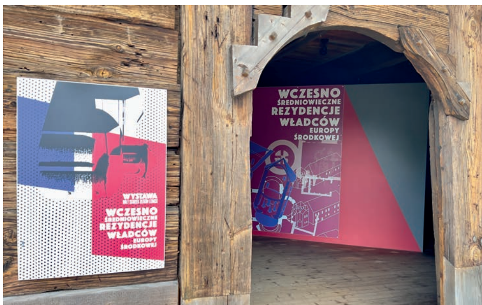
Ryc. 4. Wejście na wystawę pt. „Wczesnośredniowieczne rezydencje władców Europy Środkowej” prezentowaną w spichlerzu z Majkowo, na terenie Małego Skansenu w Muzeum Pierwszych Piastów na Lednicy.