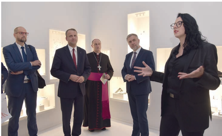
Ryc. 1. Orowadzanie po wystawie „Sześć-ścian przeszłości. Skarbiec z Ostrowa Lednickiego”.