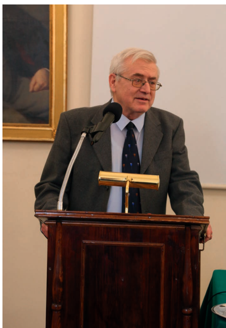
Ryc. 4. Poznań, Sala Posiedzeń PTPN. Wręczenie Księgi Jubileuszowej, 31 stycznia 2019 roku.