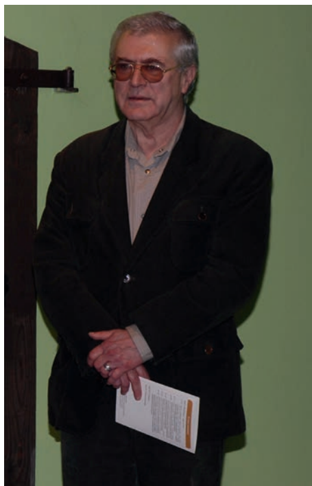
FIG. 1. Dziekanowice, Lednica Funeralia 13, 12th of May 2010.

RYC. 1. Dziekanowice. 13. edycja Funeraliów Lednickich – 12 maja 2010 roku.