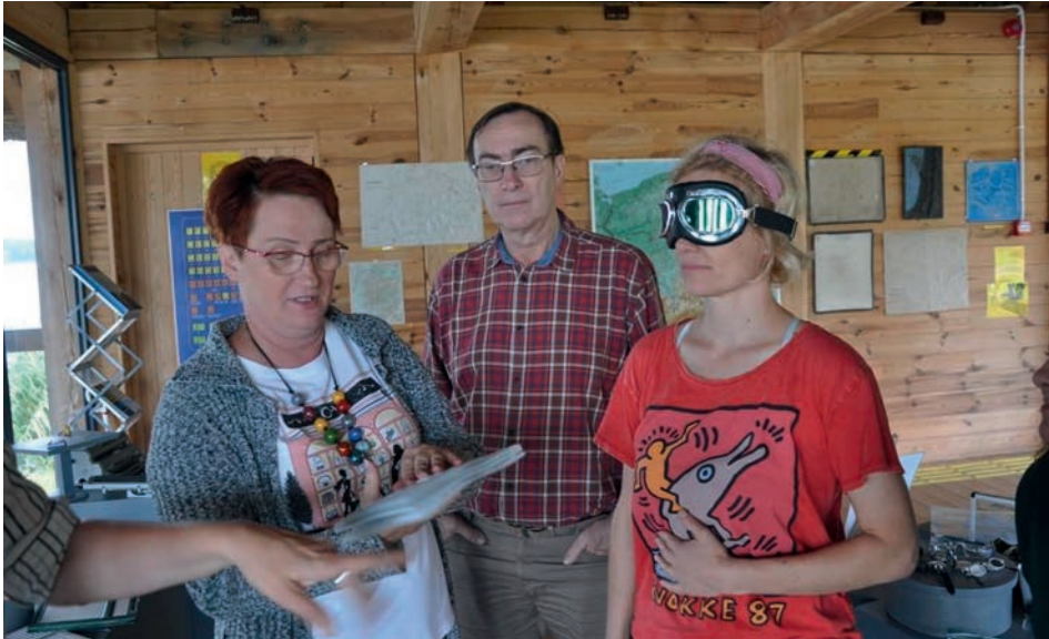
Ryc. 6. Zajęcia edukacyjne na wystawie tyflogicznej.