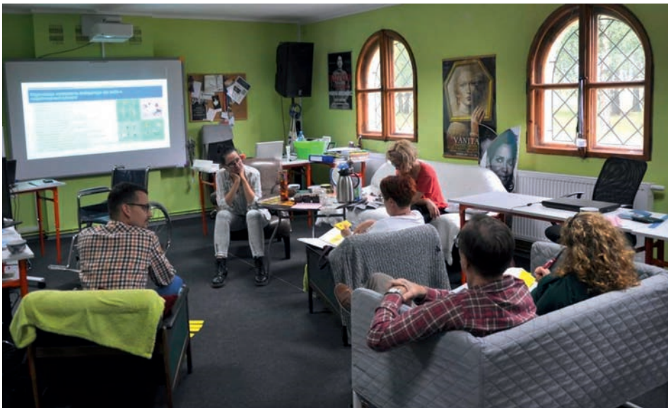
Ryc. 7. Szkolenie dotyczące szeroko pojętej dostępności w instytucjach publicznych.