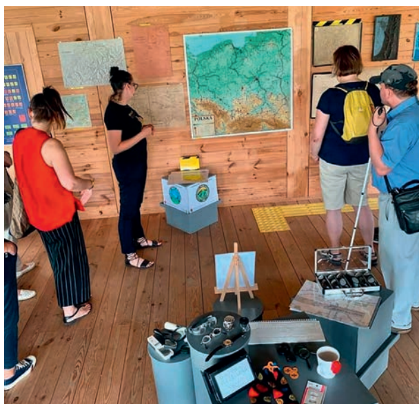
Ryc. 1. Otwarcie wystawy tyflogicznej „Zmysłowisko”.