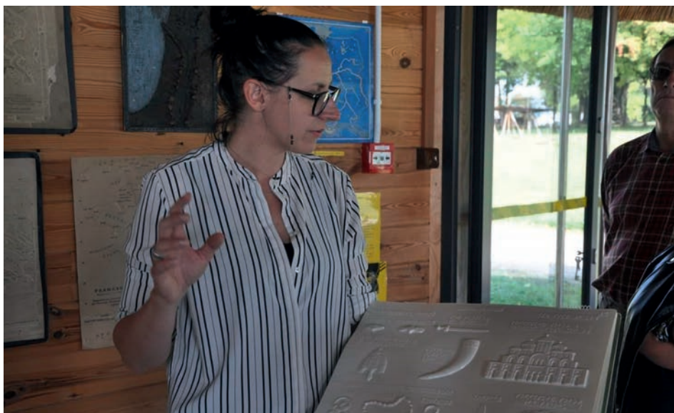
Ryc. 5. Zajęcia edukacyjne na wystawie tyflogicznej. FIG. 5. Educational activities during the typhological exhibition.