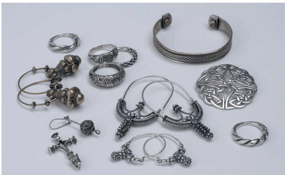
Ryc. 4. Przykładowe kopie zabytków wykorzystywane w czasie zajęć. FIG. 4. Exemplary copies of the artefacts used during meetings.