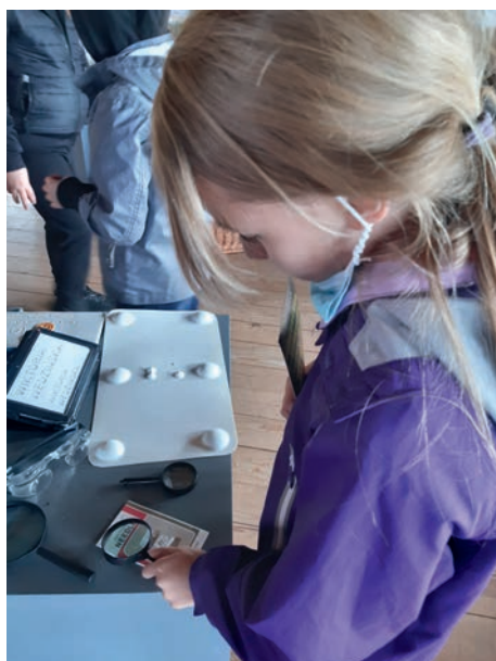
Ryc. 3. Warsztaty sensoryczne w muzeum uwrażliwiające na potrzeby osób z dysfunkcjami wzroku.