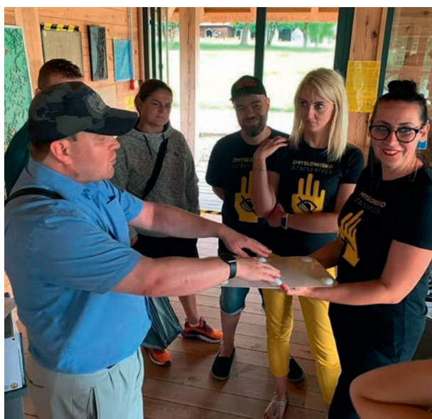
Ryc. 2. Otwarcie wystawy tyflogicznej „Zmysłowisko”.