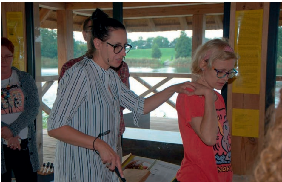
Ryc. 8. Szkolenie dotyczące szeroko pojętej dostępności w instytucjach publicznych. FIG. 8. A training session on broadly understood accessibility in public institutions.