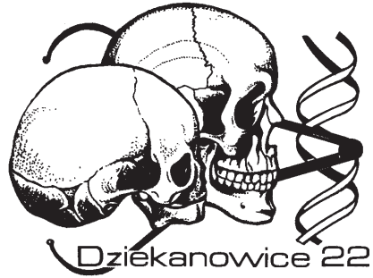
FIG. 2. Dziekanowice 22 Graphics – Jacek Wrzesiński, Wojciech Kujawa (1994)

litaria, ozdoby) pozwalały sprawującym władzę zarówno wpływać na ówczesne społeczeństwo, jak i je kontrolować. Stąd obecne w projekcie zamierzenie, by bardziej szczegółowo omówić zagadnienia związane z kruszcami czy ozdobami.