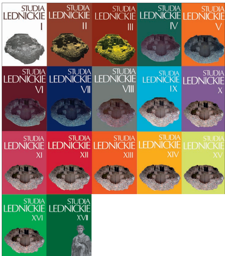
Ryc. 2. Okładki Studiów Lednickich, tomy I–XVII (1989–2018)