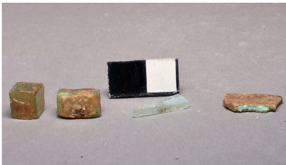
FIG. 4. Mosaic cubes and fragments of the glass vessels of the 11th–13th century after fixation; photo by Maksym Strykhar Ryc. 4. Kostki mozaikowe i fragmenty naczyń szklanych z XI–XIII wieku po konserwacji; fot. Maksym Strychar