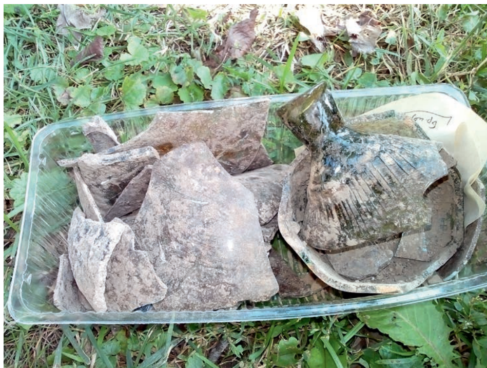
FIG. 2. Medieval glassware from the archaeological excavation 2018 on the territory of the National Reserve "Sophiya Kyivska"

The archaeological excavations of 2018 gave us glassware dated from the 11th–20th centuries: cubes of an old Russian mosaic and pieces of smalt, pharmacy dishes, medieval shutters, fragments of glass jewelry and household utensils (fig. 2–7).