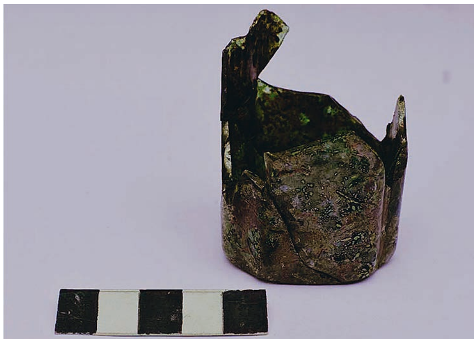
FIG. 7. Fragments of a bottle of the 17th–18th century after restoration

Рис. 6. Фрагменты бутелки з XVII–XVIII wieku в trakcie konserwacji