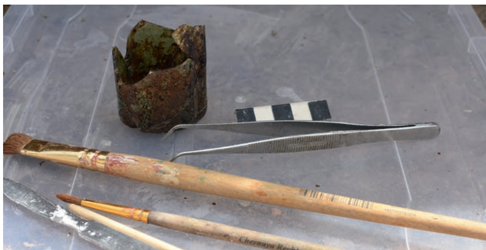
FIG. 6. Fragments of a bottle of the 17th–18th century in the process of its restoration

Рис. 6. Фрагменты бутелки з XVII–XVIII wieku в trakcie konserwacji