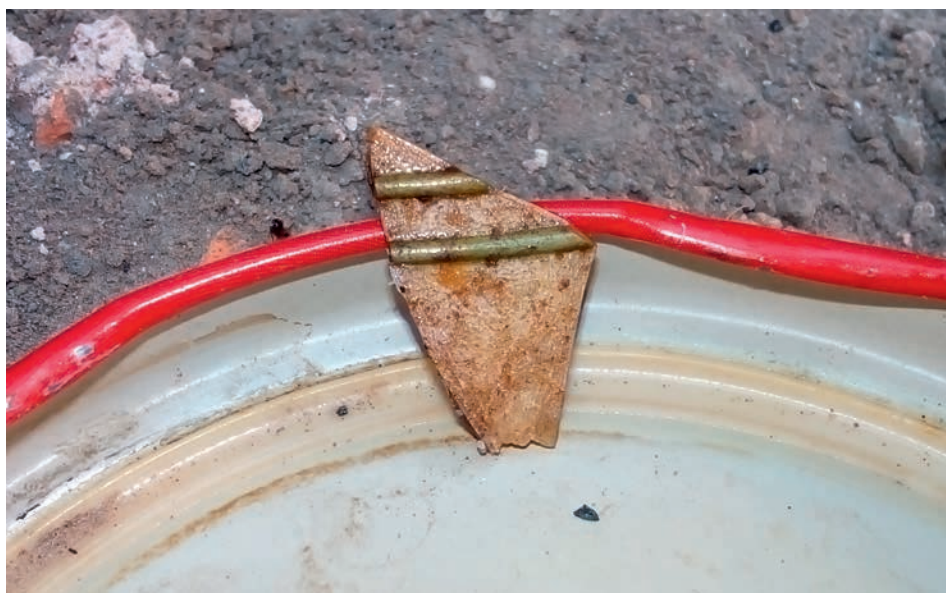
FIG. 3. Fragment of glassware of the 11th–13th century after fixation; photo by Maksym Strykhar Ryc. 3. Fragment przedmiotu szklanego z XI–XIII wieku po konserwacji; fot. Maksym Strychar