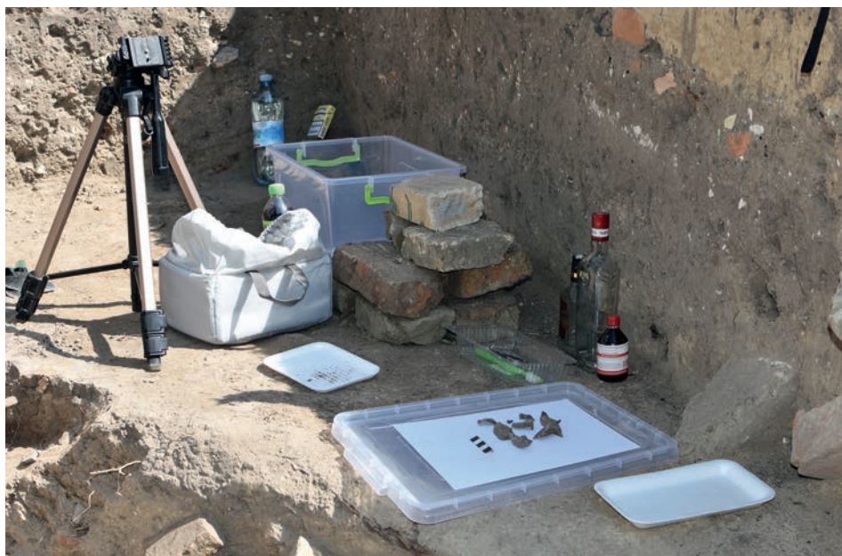
FIG. 1. The field conservation laboratory; photo by Maksym Strykhar

The archaeological group of the National Reserve “Sophia Kyivska” included a specialist restorer who had all the chemical materials for conducting the urgent conservation of various groups of artefacts, as well as glass (fig. 1) [BUREAU 2016].