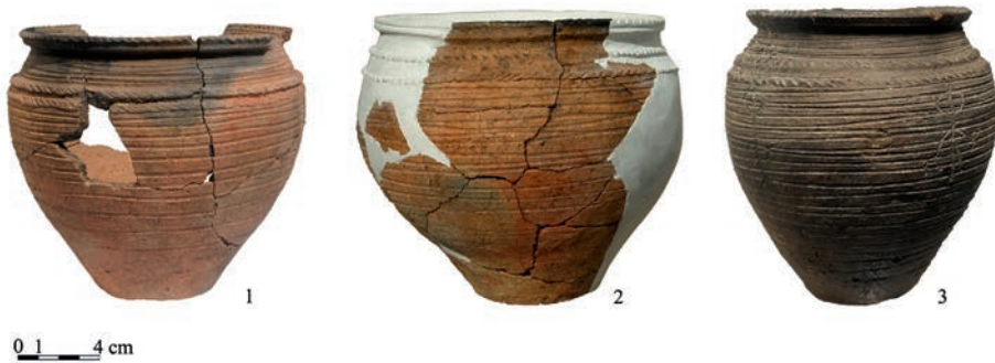
Ryc. 2. Ostrów Radzimski, gm. Murowana Goślina. Wczesnośredniowieczne garnki radzimskie; 1–2: fot. Andrzej Kowalczyk, 3: fot. Patrycja Silska, Archiwum Muzeum Archeologicznego w Poznaniu