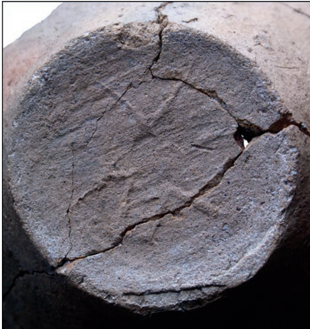
RYC. 3. Ostrów Radzimski, gm. Murowana Goślina. Dno garnka z warstwy VIa ze znakiem garncarskim; fot. Andrzej Kowalczyk FIG. 3. Ostrów Radzimski, Murowana Goślina municipality. The bottom of the pot from the VIa layer with the potter's mark; photo by Andrzej Kowalczyk

Drugi garnek wyklejono z 19 ułamków odkrytych w warstwie VIa (ryc. 1:2, 2:1). Naczynie wykonano z gliny żelazistej schudzonej domieszką naturalną — piasek (o średnicy ziaren 0,1–0,2 cm, z pojedynczymi większymi ziarnami). Naczynie jest całkowicie obtaczane, z lekko wklęsłym dnem (o średnicy 7,6 cm), ze śladami podsypki (piasek) oraz podważania dna (oderwanie od tarczy koła garncarskiego). Na dnie widać słabo odcisnięty znak garncarski, tzn. kilka wypukłych linii połączonych w trzy kąty zwrócone wierzchołkami do środka (ryc. 3). Grubość ścianek brzuśca wynosi około 0,6 cm. Największa wydętość brzuśca o łagodnym załomie i średnicy 18,8 cm, znajduje się powyżej dwóch trzecich wysokości pojemnika. Przejście brzuśca w szyjkę podkreślają dwie charakterystyczne listwy. Wylew (o średnicy 17 cm) względem zwężającej się szyjki jest wychylony na zewnątrz i podniesiony znacznie do góry, o płaskiej krawędzi zdobionej z zewnątrz i wewnątrz skośnymi nacięciami (tworzącymi motyw jodełki). Powierzchnia wewnętrzna wylewu ma wykształcony wrąb na pokrywkę pokryty