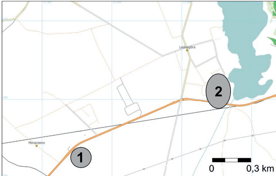
Ryc. 1. Lokalizacja stanowisk na mapie w skali 1:10 000: 1. Moraczewo stan. 16; 2. Lednogóra stan. 8; na podstawie Kart Ewidencyjnych Stanowisk Archeologicznych Moraczewo 16 i Lednogóra 8, podkład mapowy: openstreetmap.org, oprac. graf. Daria Olejniczak Fig. 1. Location of sites on a 1:10 000 map. 1. Moraczewo, site 16; 2. Lednogóra, site 8; based on Archaeological Site Record Forms Moraczewo 16 and Lednogóra 8, background map: openstreetmap.org, graphic design by Daria Olejniczak

Pierwszym przykładem będzie stanowisko w Moraczewie, wpisane do rejestru zabytków, które niczym szczególnym na powierzchni ziemi się nie wyróżnia. Zlokalizowane jest ono po południowo-wschodniej stronie szosy Poznań–Gniezno. Odkrycia tego pięciohektarowego stanowiska dokonał Czesław Strzyżewski w 1982 roku w ramach programu badawczego pod nazwą Archeologiczne Zdjęcie Polski. Podczas badań powierzchniowych zarejestrowano liczny materiał archeologiczny w postaci ceramiki naczyniowej, której datowanie pozwala stwierdzić osadnictwo na tym terenie od czasów schyłkowego neolitu. Powyższy obszar w późniejszej fazie został zasiedlony przez ludność kultury łużyckiej, a w średniowieczu powstała osada otwarta. Ponadto stwierdzono ślad z okresu nowożytnego 23 , a patrząc na współczesne mapy, można wysnuć wniosek, że warunki siedliskowe są na tyle dobre, że do dziś teren ten jest systematycznie zabudowywany.