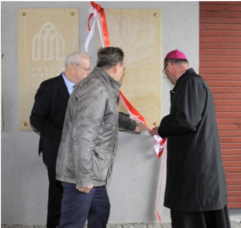
Ryc. 4. Odsłonięcie tablicy pamiątkowej