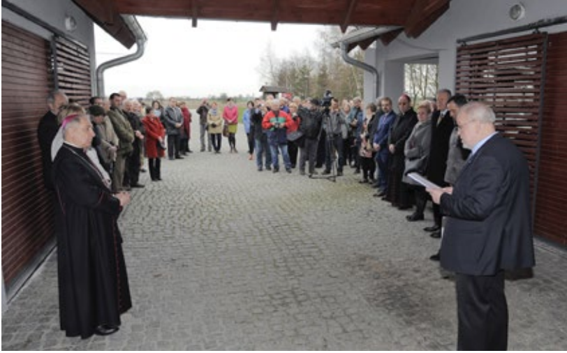
Ryc. 3. Odczytanie preambuły przed odsłonięciem tablicy pamiątkowej