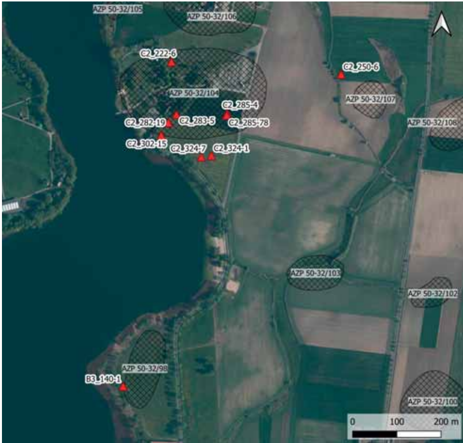
RYC. 1. Ortofotomapa z dyspersją znalezisk monet rzymskich wraz z zasięgiem zewidencjonowanych stanowisk archeologicznych. Oprac. M. Kostyrko