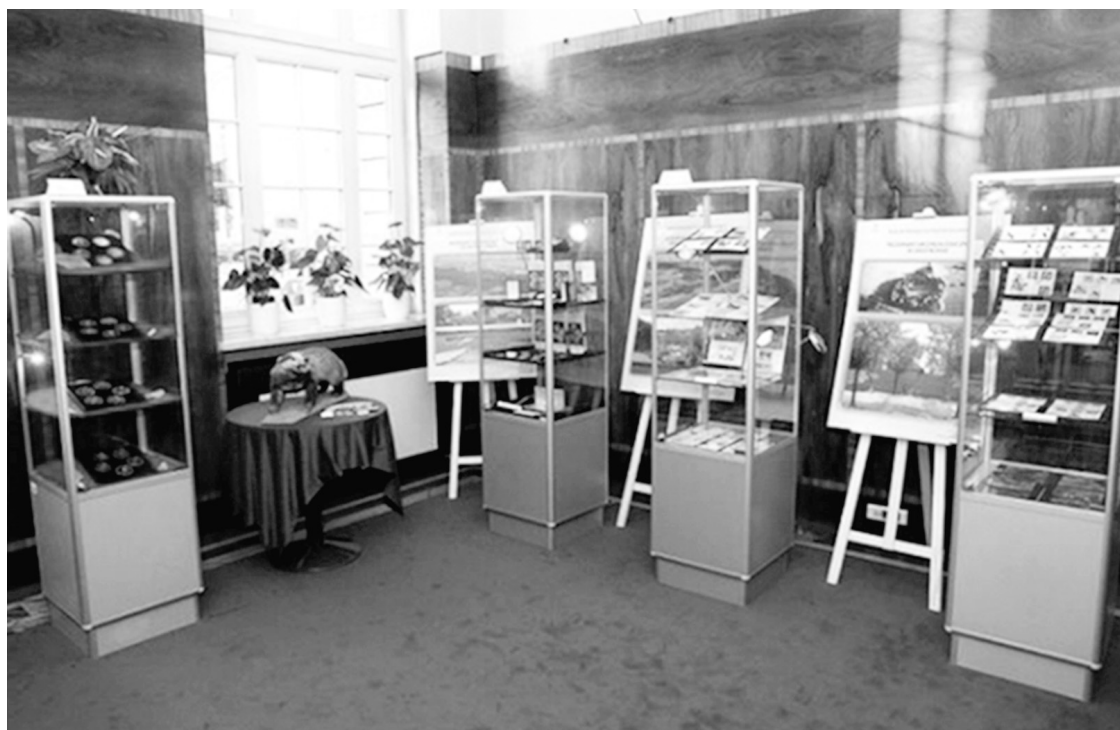
Fot. 1. Fragment sali wystawowej