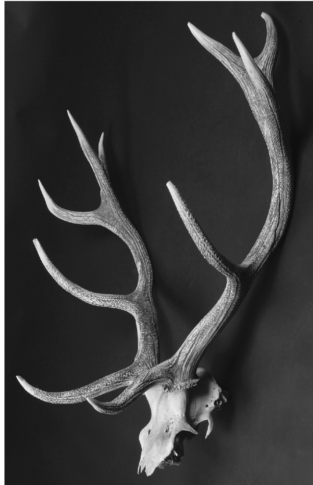
Fot. 1. Nienawiszcz, gm. Rogoźno, pow. Oborniki. Jeleń byk I — dziesiątak regularny, koronny

Stan czaszki, a właściwie brak większej części kości czaszki, w tym przede wszystkim żębów, uniemożliwia dokładne ustalenie wieku osobnika zarówno metodą