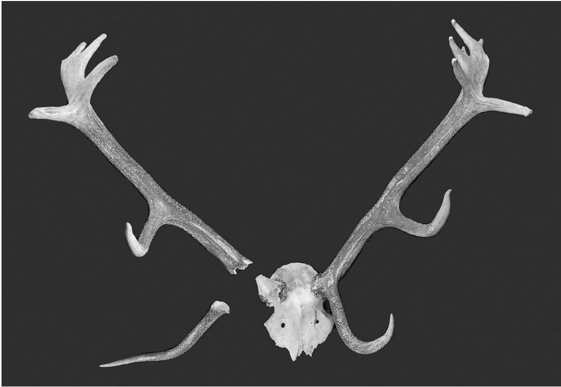
Fot. 2. Nienawiszcz, gm. Rogoźno, pow. Oborniki. Jeleń byk II — czternastak nieregularny, koronny