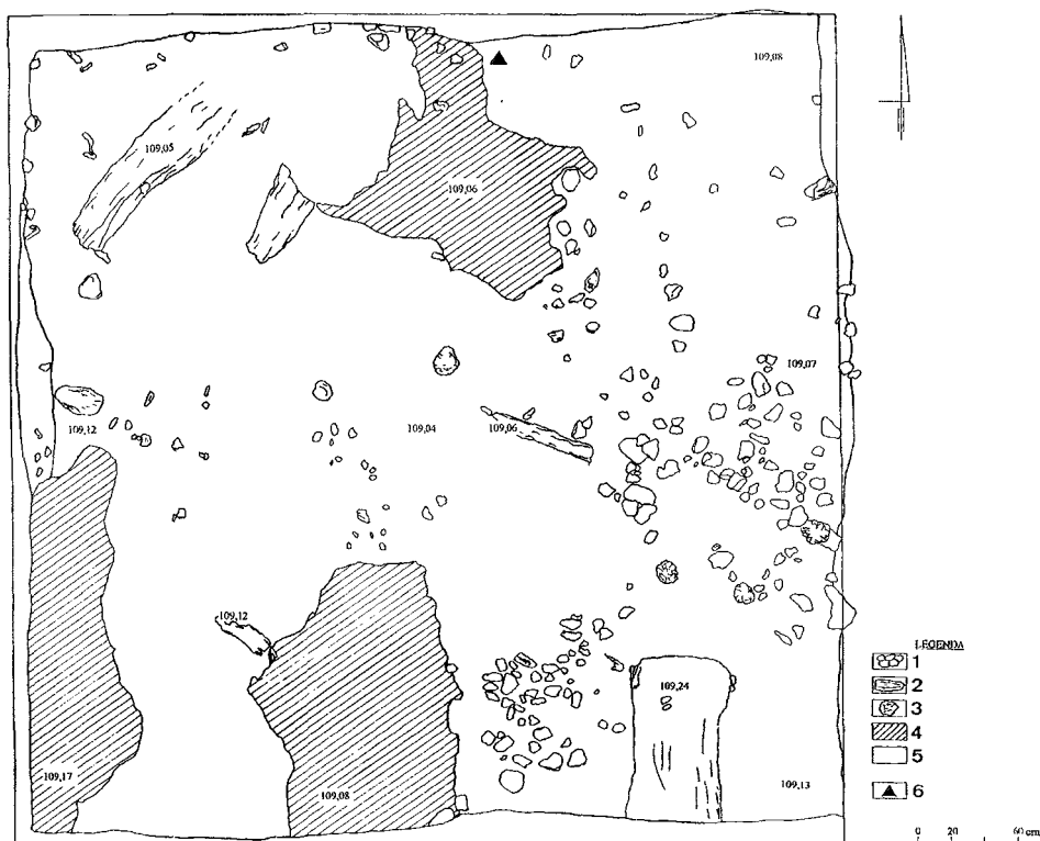
Ryc. 2. Rybitwy-Ostrów Lednicki st. 2, wykop 1/99, ów. B. Rzut poziomy warstwy II. 1 — bruk kamienny; 2 — drewniane pozostałości konstrukcji mostu; 3 — główki pali; 4 — w-wa IIp-zółta, piaszczysta ziemia; 5 — w-wa III-tłusta, brązowa ziemia z węgielkami i drewnem; 6 — miejsce odkrycia „skarbu”