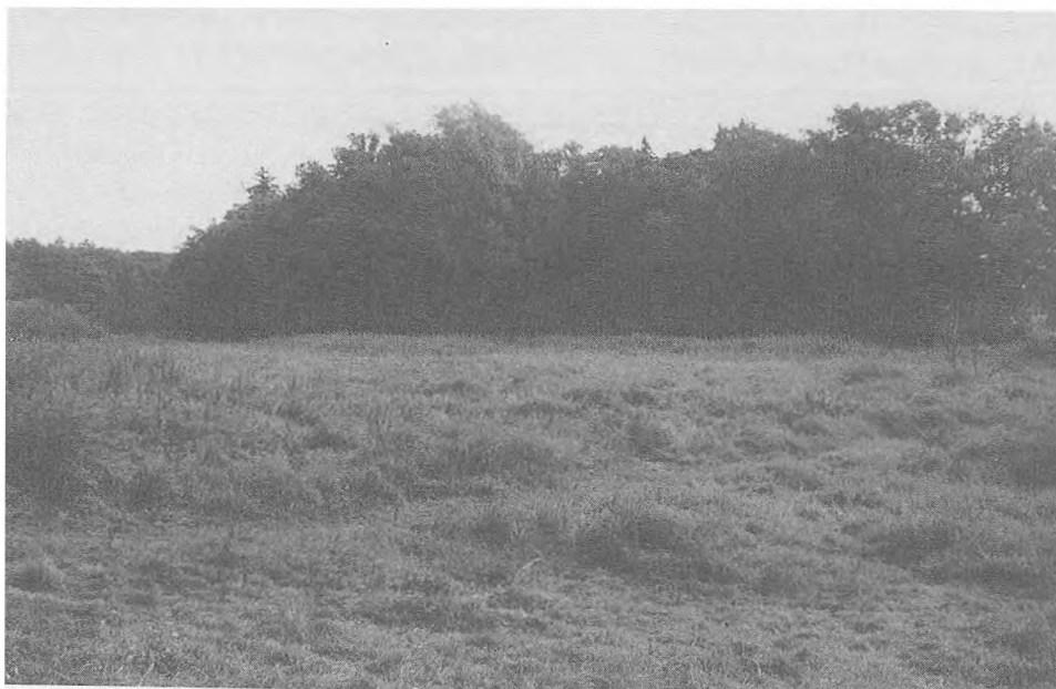
Widok na grodzisko radzimski od strony północno-zachodniej (Fot. R. Aleksandrowicz).