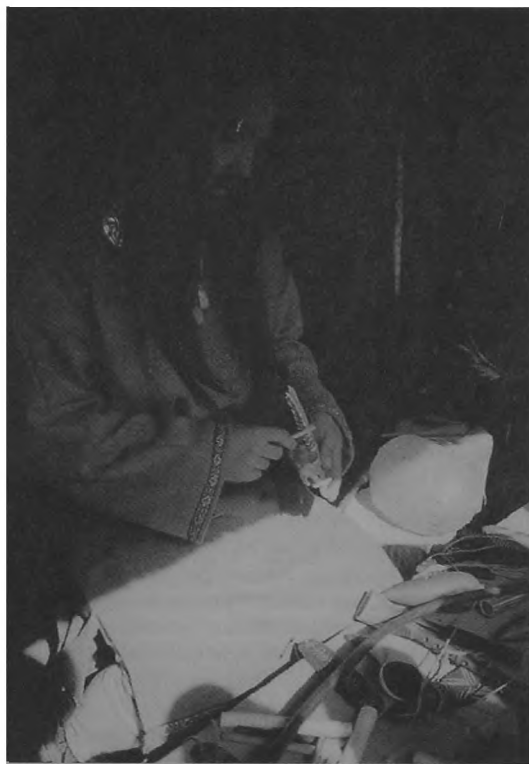
Ryc. 1. Biskupin — stoisko z instrumentami muzycznymi.