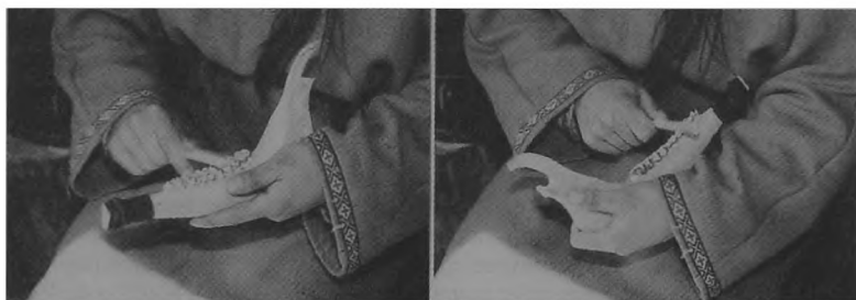
Ryc. 2. Biskupin — sposób trzymania tarła z żuchwy zwierzęcej.