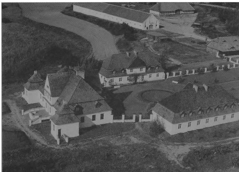
Ryc. 4. Wielkopolski Park Etnograficzny — fragment zespołu dworsko-folwarcznego.

nie wybranych, szeroko rozumianych muzealiów ma stać się etnograficznym metoni- mem kultury wsi wielkopolskiej.