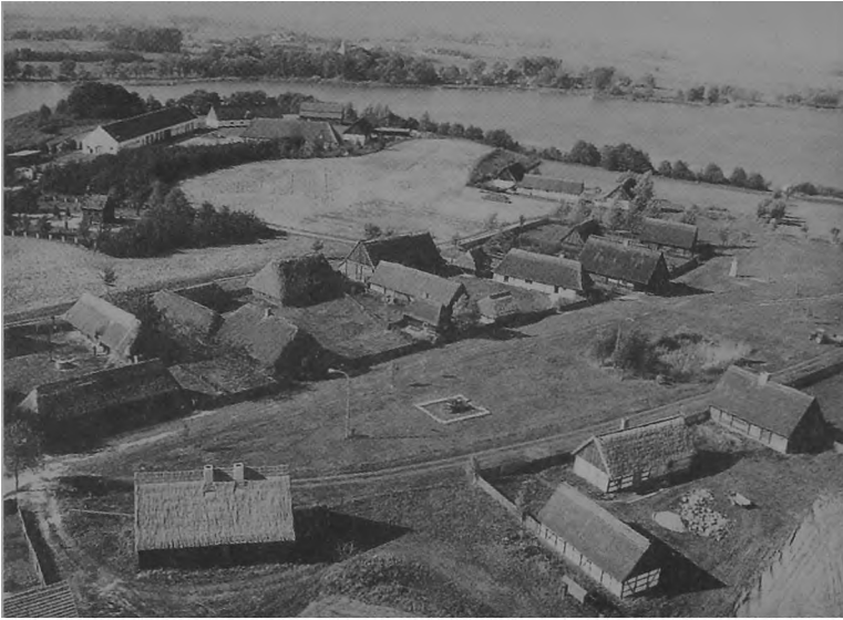
Ryc. 3. Wielkopolski Park Etnograficzny — fragment nawisia.

wadzić do wprowadzenia w ów plan wielu istotnych zmian wynikających z określenia zasięgu terytorialnego działania przyszłego muzeum (skansenu), pojawienia się nowych trendów w muzealnictwie skansenowskim (problemy kopii, układu przestrzennego, charakteru prezentowanych obiektów, infrastruktury itp.), wskazań zawartych w planie zagospodarowania przestrzennego obrzeży jeziora Lednica, perspektywy pozyskania typowych obiektów oraz możliwości kompozycji układu zabudowy — wynikających z konfrontacji pozyskanego terenu z programem merytorycznym.