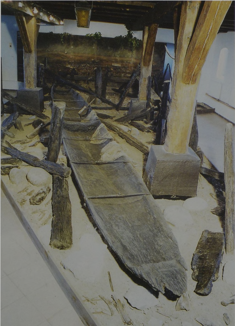
Ryc. 2. Łódź z jeziora Lednickiego w nowym wnętrzu ekspozycyjnym Muzeum Pierwszych Piastów na Lednicy Abb. 2. Boot aus dem Lednica-See in neuem Ausstellungssaal des Museums der Ersten Piasten auf Lednica