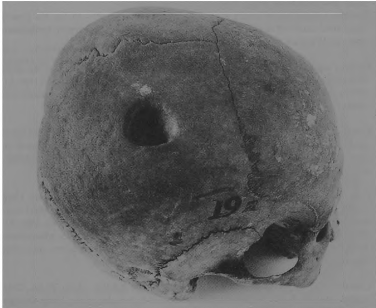
Ryc. 8. Dziekanowice, stan. 22. Luźna czaszka kobiety.