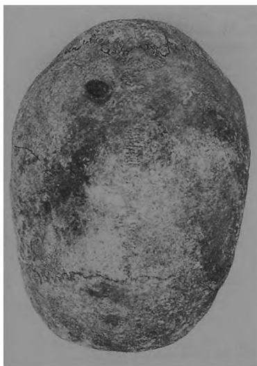
Ryc. 12. Dziekanowice, stan. 22. Czaszka mężczyzny z obiektu III/92.