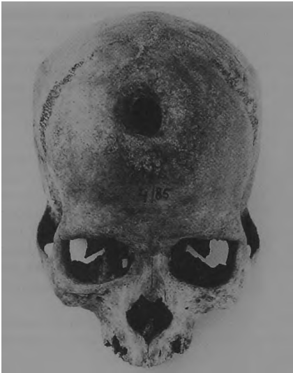
Ryc. 7. Dziekanowice, stan. 22. Czaszka mężczyzny z grobu 4/85.