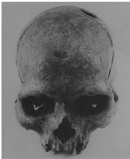
Ryc. 10. Dziekanowice, stan. 22. Czaszka mężczyzny z grobu 15/94.