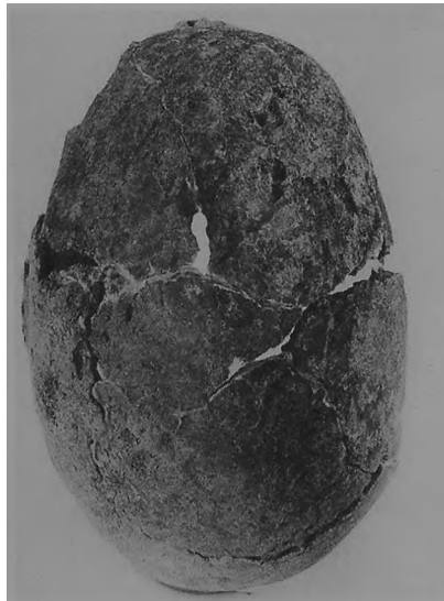
Ryc. 6. Dziekanowice, stan. 22. Czaszka mężczyzny z grobu 7/94.