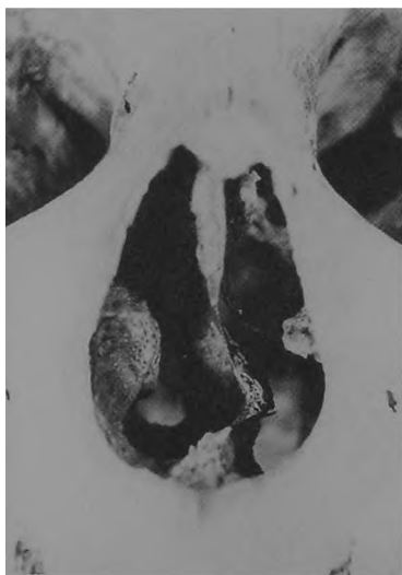
Ryc. 11. Dziekanowice, stan. 22. Czaszka mężczyzny z grobu 15/94.