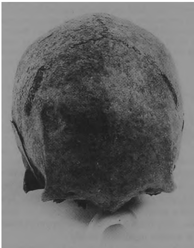
Ryc. 1. Dziekanowice, stan. 22. Czaszka kobiety z grobu 32/94.