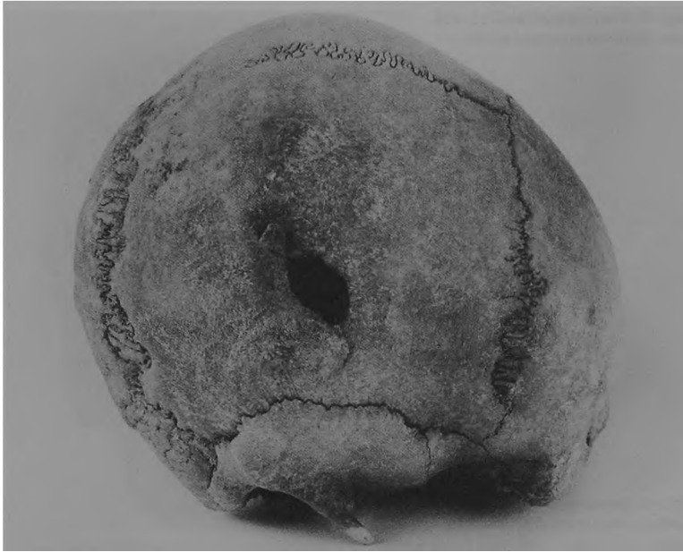
Ryc. 5. Dziekanowice, stan. 22. Czaszka mężczyzny z grobu 21/92.