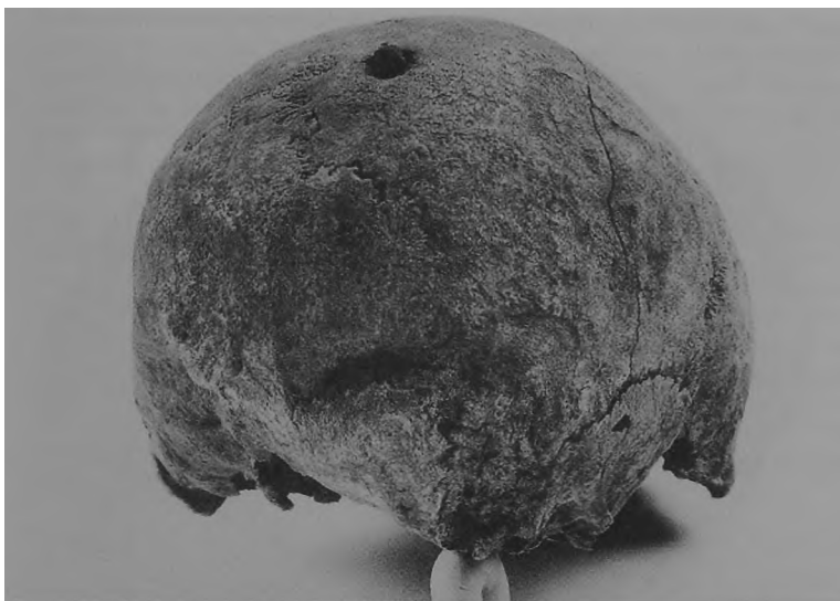
Ryc. 14. Dziekanowice, stan. 22. Czaszka mężczyzny z obiektu III/92.

(ryc. 5), drążące złamanie otwarte, z odłupaniem o kształcie podłużnym, stanowiący pozostałość cięcia ostrym narzędziem, mieczem lub toporem? Wymiary wewnętrzne urazu 21 \times 12 mm, a zewnętrzne 50 \times 28 mm. Wygojenie blizny wskazuje na przeżycie mimo urazu.