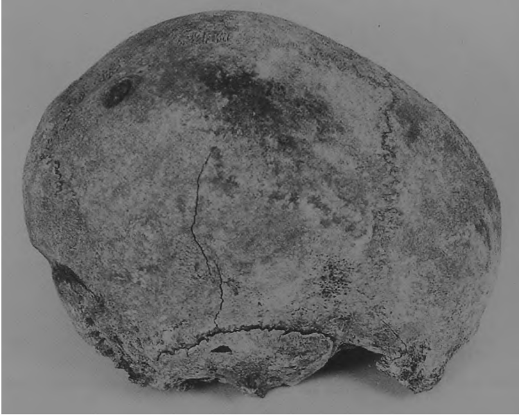
Ryc. 15. Dziekanowice, stan. 22. Czaszka mężczyzny z obiektu III/92.

mawiają głęboko zarysowane brzegi. Opadający brzeg jest charakterystyczny dla zaleczonej, pourazowej trepanacji czaszki.