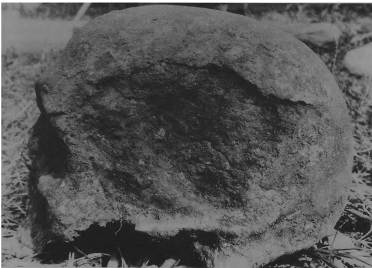
Ryc. 2. Dziekanowice, stan. 22. Czaszka mężczyzny z grobu 24/93.