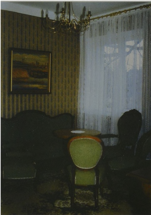
Fot. 4 Wnętrza nowej siedziby Muzeum