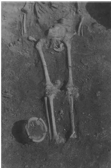
Ryc. 2. Dziekanowice, st. 22. Grób 26/92