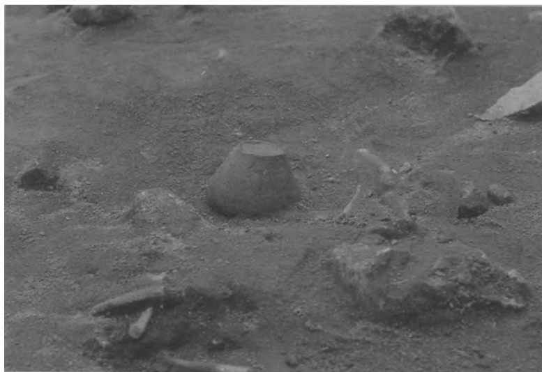
Ryc. 4. Dziekanowice, st. 22. Grób 5/93

kusety tkanka mięsna i tkanka kostna powinny ulec całkowitemu rozkładowi i przekształceniu w sole nieorganiczne. Substancje te mogły osadzić się na drobinach piasku obecnego w naczyniach.