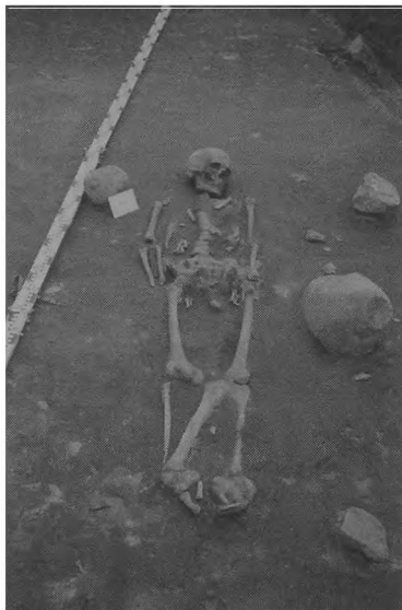
Ryc. 3. Dziekanowice, st. 22. Grób 10/93

tego w wieku 25 – 30 lat (grób 10/93) (ryc. 3). W wyniku powtórnego pochówku w tym samym miejscu dziecka 3 – 4-letniego (grób 5/93) naczynie zostało przewrócone i znaleziono je odwrócone dnem do góry przy prawym biodrze mężczyzny (ryc. 4) 4 .