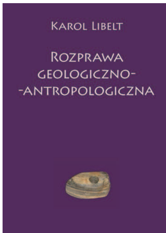
Ryc. 2. Pierwsza strona okładki książki K. Libelta Rozprawa geologiczno-antropologiczna ; projekt. W. Kujawa, A.M. Wyrwa; oprac. G. Kalisiak