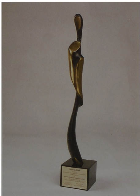
Ryc. 2. Nagroda Izabella 2003 dla albumu „Wielkopolski Park Etnograficzny w Dziekanowicach” Abb. 2. Preis Izabella 2003 für das Album „Wielkopolski Park Etnograficzny w Dziekanowicach” (Großpolnischer Ethnographischer Park in Dziekanowice)