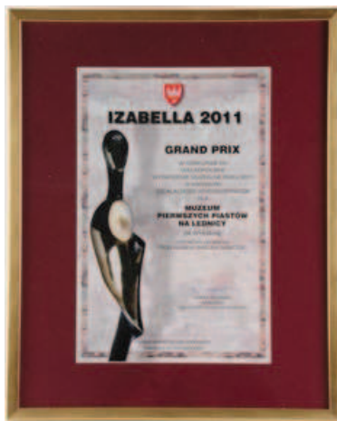
Fot. 4. Izabella 2001–2011 — okolicznościowy dyplom dla Muzeum Pierwszych Piastów