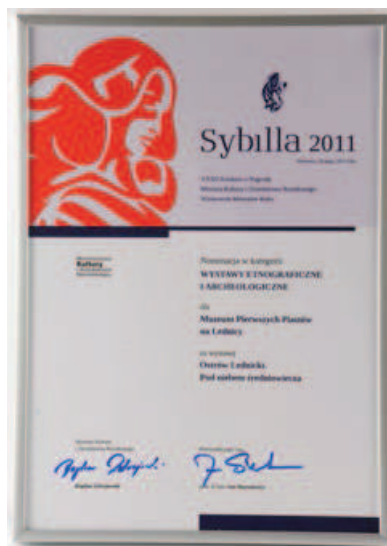
Fot. 2. Sybilla 2011 — okolicznościowy dyplom dla Muzeum Pierwszych Piastów