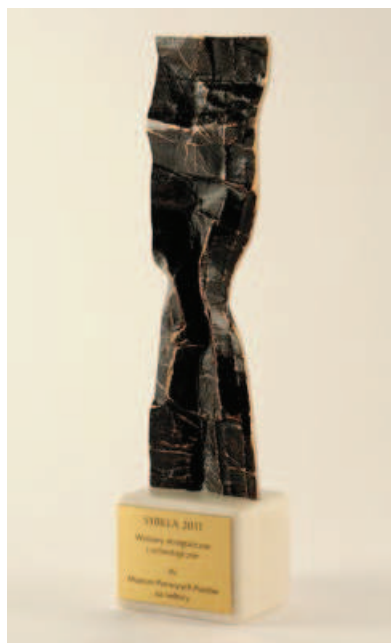
Fot. 1. Sybilla 2011 — statuetka

Równie ważna była dla Muzeum kolejna z nagród, jaką otrzymaliśmy w 10. edycji konkursu na najwybitniejsze wydarzenie muzealne roku w Wielkopolsce Izabella 2012 organizowanej przez Fundację Muzeów Wielkopolskich pod patronatem Marszałka Województwa Wielkopolskiego. 24 maja 2012 roku w gościnnie wewnątrz Muzeum w Dobrzycy na ręce wicedyrektora Muzeum Marka Krężałka oraz autorów ekspozycji przekazano Grand Prix (statuetkę Izabelli) oraz okolicznościowy dyplom.