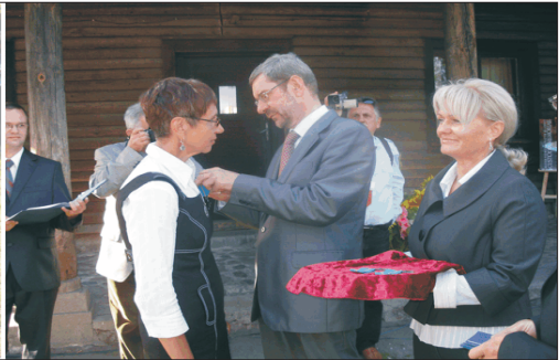
Fot. 8. Jubileusz 40-lecia Muzeum. Odznaczenia wręczają - minister Tomasz Merta i przewodniczący Sejmiku Województwa Wielkopolskiego 40th Anniversary of the Museum. The awards are being given by minister Tomasz Merta and the chairman of the regional council of Wielkopolskie Voivodeship