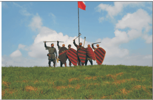
Fot. 5. W grodzie Mieszka In the stronghold of Mieszko