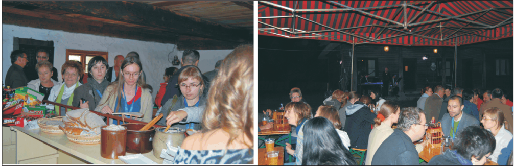
Fot. 10. Uczestnicy konferencji "muzealnej" Participants of the Museum Conference