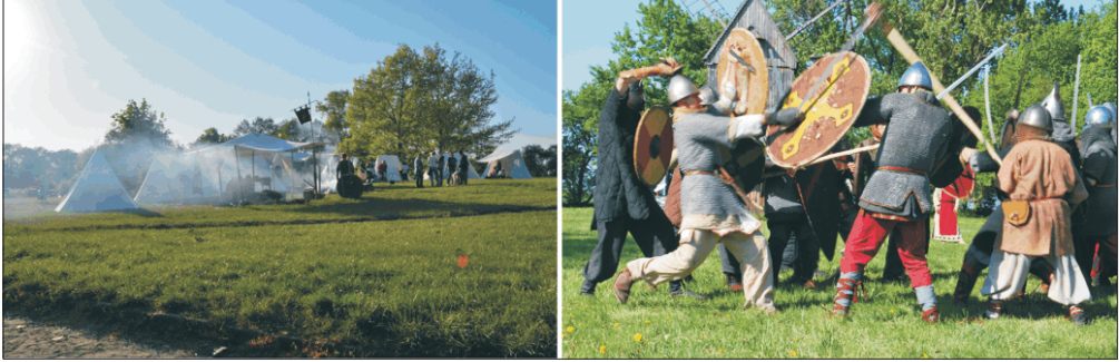
Fot. 1. Majówka nad Lednicą May picnic at Lednica