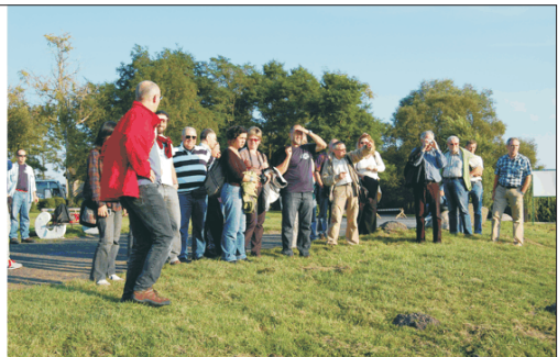
Fot. 9. Uczestnicy konferencji "rybnej" zwiedzają Muzeum Participants of the Fish Conference are visiting the Museum