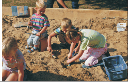
Fot. 7. Europejskie Dni Dziedzictwa - piknik naukowy European Heritage Days - scientific picnic