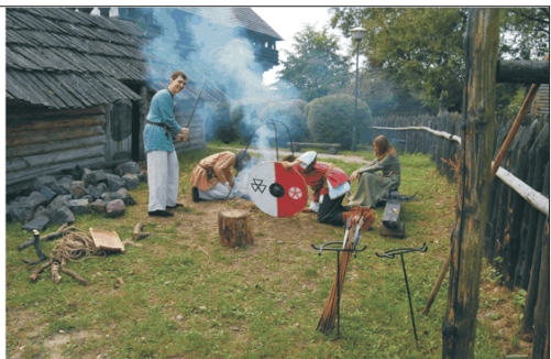
Fot. 6. Europejskie Dni Dziedzictwa - piknik historyczny European Heritage Days - historical picnic