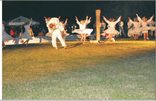
Fot. 4. Noc Kupały Kupala Night