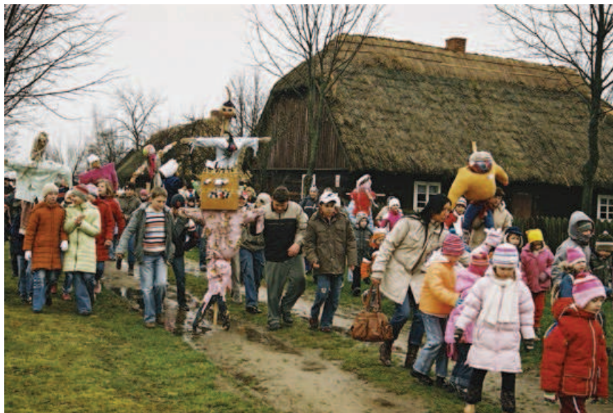
Ryc. 13. Wielkopolski Park Etnograficzny. Marzanna; fot. M. Jóźwikowska Fig. 13. The Wielkopolska Ethnographic Park in Dziekanowice — Marzanna (straw and paper effigy associated with Slavonic goddess of death and rebirth of nature meant for burning and drowning on the 21st of March as a symbol of the triumph of spring over winter); photograph by M. Jóźwikowska