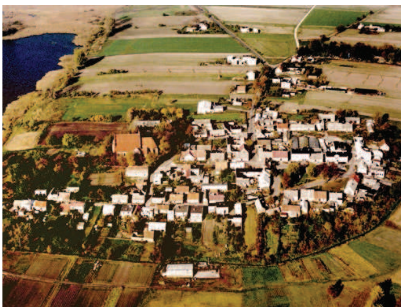
Ryc. 8. Zabytkowe przestrzenie urbanistyczne wsi i miasteczek — Wieś Łekno (od 1370–1888 miasto), gm. Wągrowiec — układ urbanistyczny z ok. 1548 roku

Fig. 7. Landscape and natural space — the meanderings of the Noteć River in the vicinities of Wielień nad Notecią