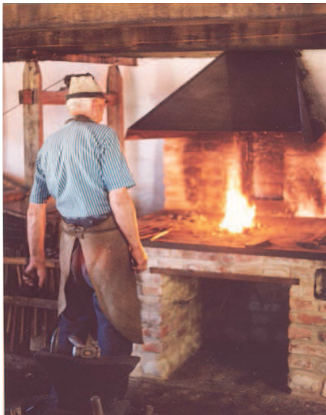
Ryc. 15. Animacja życia w XIX-wiecznej wsi wielkopolskiej. Kowal — zapomniane zajęcia i zawody

Fig. 15. Living history — reenactment in the nineteenth-century Greater Polish village. A blacksmith — forgotten occupations and professions