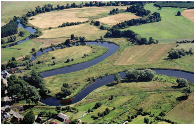
Ryc. 7. Przestrzeń krajobrazowo-przyrodnicza — meandry Noteci w okolicach Wielenia nad Notecią

Fig. 7. Landscape and natural space — the meanderings of the Noteć River in the vicinities of Wielień nad Notecią