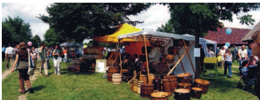
Ryc. 14. Wielkopolski Park Etnograficzny. Żywy Skansen — prezentacja dawnych rzemiosł i twórców ludowych; fot. A. Ziółkowski Fig. 14. The Wielkopolska Ethnographic Park in Dziekanowice. Open-air Museum Alive — presentation of traditional craftsmanship and artists; photograph by A. Ziółkowski

Kultura ma to do siebie, że nie zamyka się sama w sobie. Pod wpływem różnych czynników z punktów „inicjacji” zawsze rozchodziła i rozchodzi się na inne obszary, gdzie adaptowana i akceptowana dawała i daje asumpt do rozwoju cywilizacyjnego. Te aspekty też są przedmiotem badań i poznania etnografów i etnologów oraz historyków, którzy starają się rekonstruować świat polskiej wsi z różnych okresów,