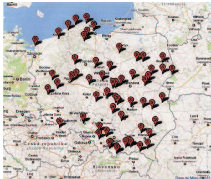
Ryc. 5. Skanseny etnograficzne na ziemiach polskich