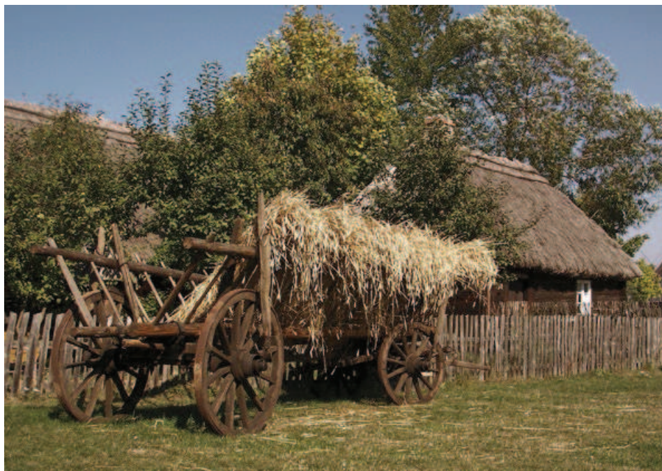
Ryc. 4. Wielkopolski Park Etnograficzny w Dziekanowicach Fig. 4. The Wielkopolska Ethnographic Park in Dziekanowice

Zawsze aktualna jest zatem potrzeba dokumentowania i zabezpieczenia dla następnych pokoleń śladów minionej rzeczywistości, wszystkiego, co odziedziczyliśmy po poprzednikach, i tego, co wytwarzamy dziś sami, albowiem, jak powiedzieliśmy, każde nasze dzieło natychmiast staje się historią. Jeśli więc zaginie, to zaginie też pamięć o nas.