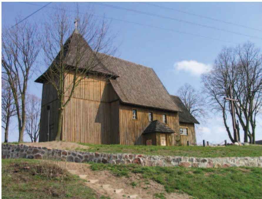
Ryc. 9. Kościół pw. św. Mikołaja w Tarnowie Pałuckim. Najstarszy drewniany kościół na ziemiach polskich