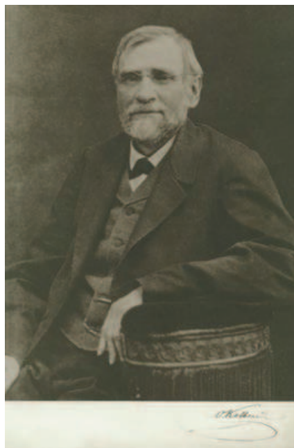
Ryc. 2. Oskar Kolberg (1814–1890) Fig. 2. Oskar Kolberg (1814–1890)