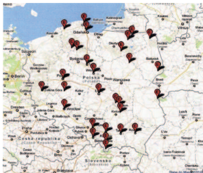
Ryc. 6. Muzea etnograficzne na ziemiach polskich; wg http://www.museo.pl/content/view/285/239/