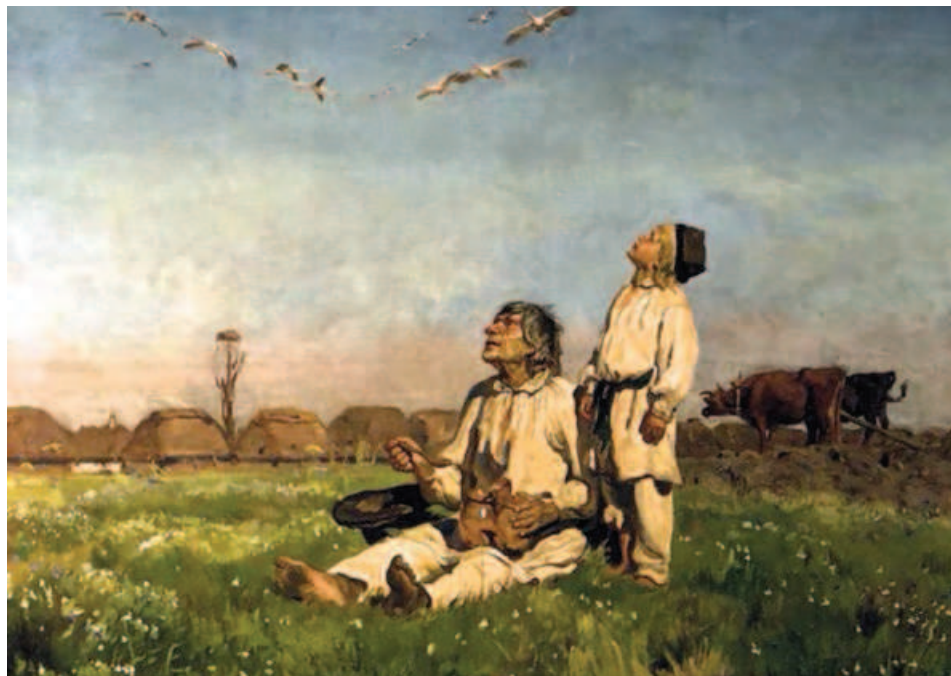
Ryc. 3. Józef Chełmoński, Bociany (1900); wg http://galeria.klp.pl/p-6170.html Fig. 3. Józef Chełmoński, The Storks (1900); after http://galeria.klp.pl/p-6170.html

miała być stała ochrona i zabezpieczenie wartości, które w „nowych — w danym momencie współczesnych czasach” zaczynały być uznawane za przeżytek. Istniała jednak świadomość i grupa ludzi, których celem stało się zabezpieczenie dzieł minionej rzeczywistości dla potomnych, aby opowiadały o przeszłych, a w konsekwencji też o współczesnych im czasach, bo i one przeminęły i przemijają.