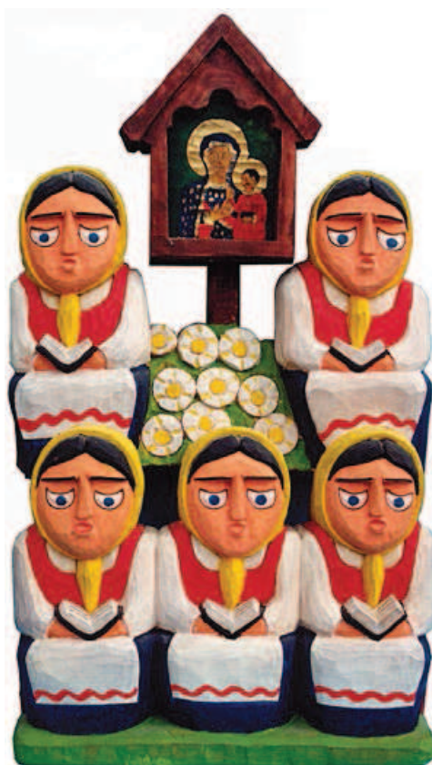
Ryc. 12. Piotr Staszak, Majowe pod kapliczką, Zbiory WPE w Dziekanowicach

Fig. 12. Piotr Staszak, May Devotions to the Blessed Virgin Mary at the Roadside Shrine, collections of the Wielkopolska Ethnographic Park in Dziekanowice