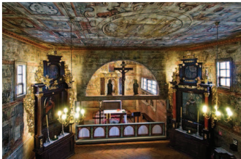
Ryc. 10. Tarnowo Pałuckie. Kościół pw. św. Mikołaja — widok na prezbiterium